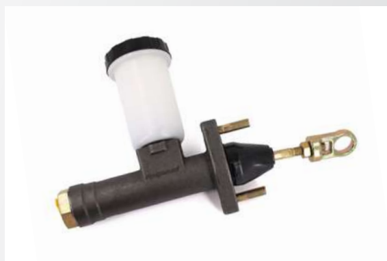
ГЛАВНЫЙ ЦИЛИНДР ПРИВОДА СЦЕПЛЕНИЯ

Конструктивно оба варианта полностью соответствуют оригинальным деталям, обеспечивая при этом достойный уровень качества и гарантируют надежную работу. Продукция сертифицирована.