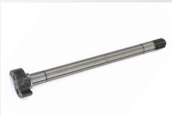
КУЛАК РАЗЖИМНОЙ ЗАДНЕГО ТОРМОЗА ПРАВЫЙ