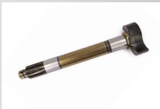
КУЛАК РАЗЖИМНОЙ ПЕРЕДНЕГО ТОРМОЗА ЛЕВЫЙ