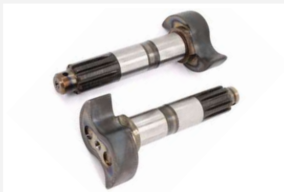
КУЛАК РАЗЖИМНОЙ ЗАДНЕГО ТОРМОЗА ПРАВЫЙ

Их простая, но прочная конструкция, состоящая из минимума элементов, обеспечивает максимальную механическую прочность и устойчивость к интенсивным нагрузкам.