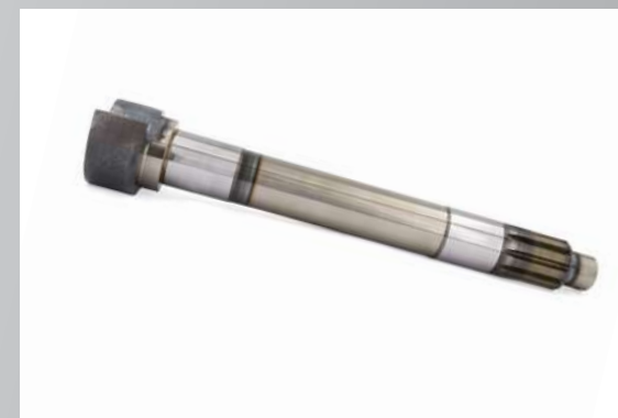
КУЛАК РАЗЖИМНОЙ ПЕРЕДНЕГО ТОРМОЗА ПРАВЫЙ