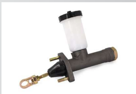
ГЛАВНЫЙ ЦИЛИНДР ПРИВОДА СЦЕПЛЕНИЯ