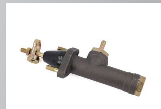
ГЛАВНЫЙ ЦИЛИНДР ПРИВОДА СЦЕПЛЕНИЯ