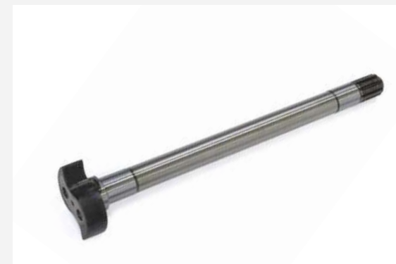
КУЛАК РАЗЖИМНОЙ ЗАДНЕГО ТОРМОЗА ЛЕВЫЙ