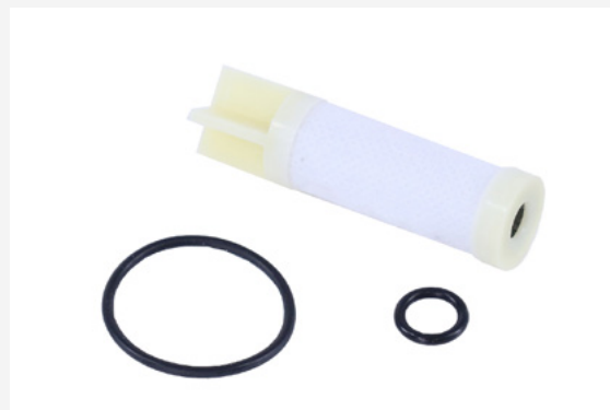
ЭЛЕМЕНТ ГАЗОВОГО ФИЛЬТРА ВЫСОКОГО ДАВЛЕНИЯ