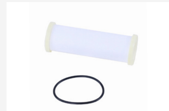
ЭЛЕМЕНТ ГАЗОВОГО ФИЛЬТРА НИЗКОГО ДАВЛЕНИЯ