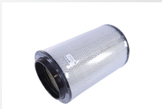
ЭЛЕМЕНТ ВОЗДУШНОГО ФИЛЬТРА