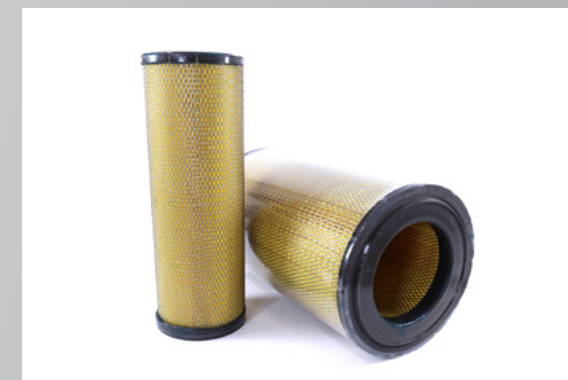
ЭЛЕМЕНТ ВОЗДУШНОГО ФИЛЬТРА