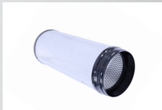
ЭЛЕМЕНТ ВОЗДУШНОГО ФИЛЬТРА